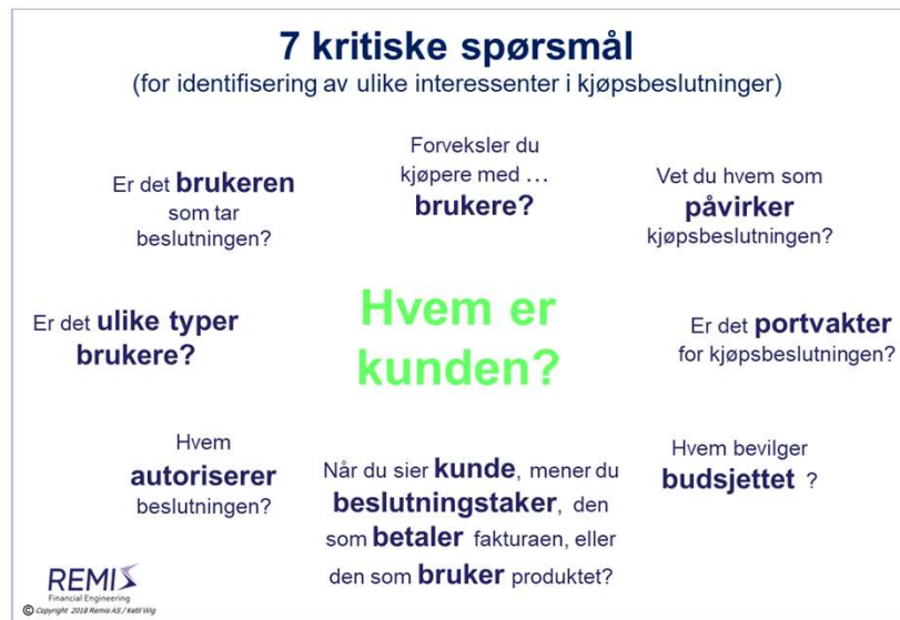
Figur 2: Syv kritiske spørsmål for å identifisere interessenter i kjøpsprosesser

Et segment er derfor en målgruppe der konkurransestrategien er utformet på en bestemt måte for å «vinne» kjøpsbeslutningene.