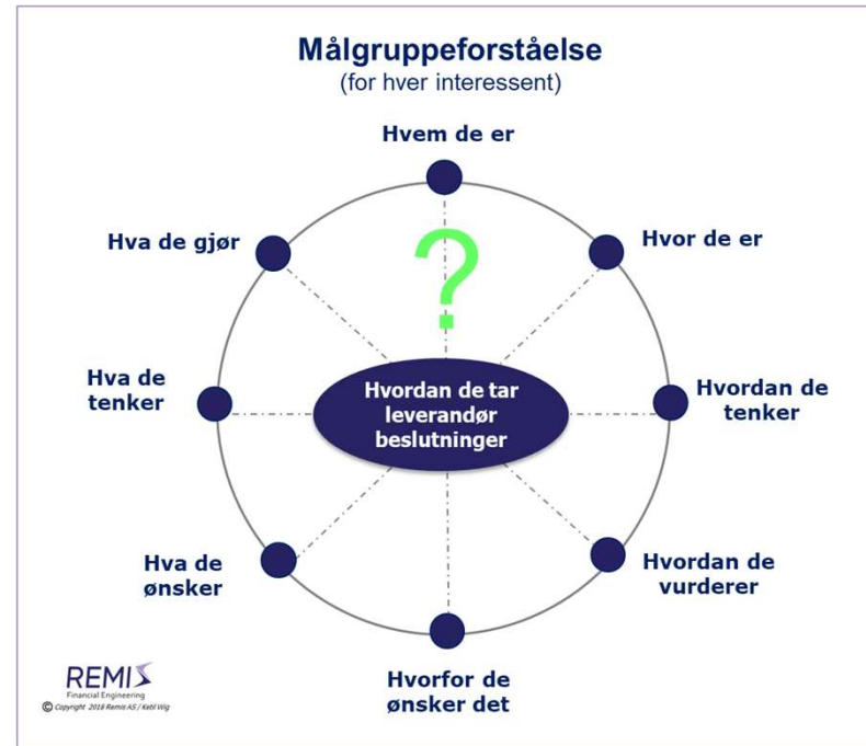
Figur 1: En grunnleggende forståelse av målgrupper som basis for segmentering